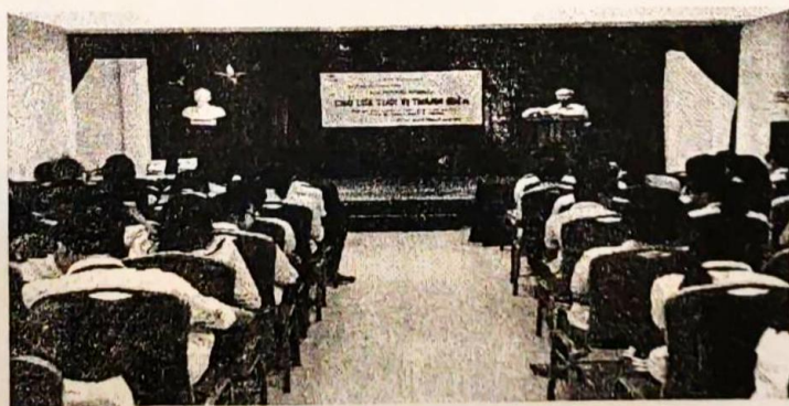
Hình 3. Buổi nói chuyện chuyên đề: “Kỹ năng sống cho lứa tuổi vị thành niên” tại Thư viện Hà Nội.

Việc tổ chức nói chuyện theo chuyên đề gắn liền với trang bị kỹ năng sống được đẩy mạnh.