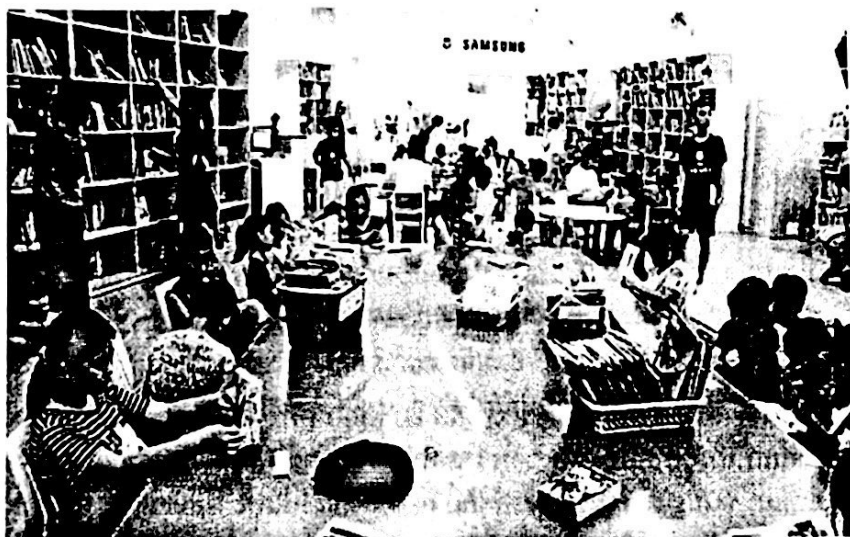
Ảnh: Không gian đọc sách cho thanh thiếu niên tại Thư viện Khoa học Tổng hợp Đà Nẵng [2]

thành phố sử dụng các dịch vụ của thư viện công cộng. Trung bình mỗi năm, hệ thống thư viện công cộng của thành phố Đà Nẵng được bổ sung hơn 17.600 bản sách giấy, gần 1.200 bản sách điện tử và 235 đầu báo - tạp chí khác, giúp gần 8.700 lượt người mượn đọc, góp phần nâng cao văn hóa, chất lượng đọc trong cộng đồng. Thư viện cũng đã hoàn thành số hoá nguồn tài liệu địa chỉ, tài liệu quý hiếm các công trình nghiên cứu khoa học tại chỗ với tổng số 2.315 tài liệu. Bên cạnh đó, người quản lý, điều hành cũng dễ dàng nắm được thông tin nguồn tài liệu mà bạn đọc tìm kiếm nhiều nhất, để từ đó có hướng bổ sung, đáp ứng nhu cầu của bạn đọc. [2]