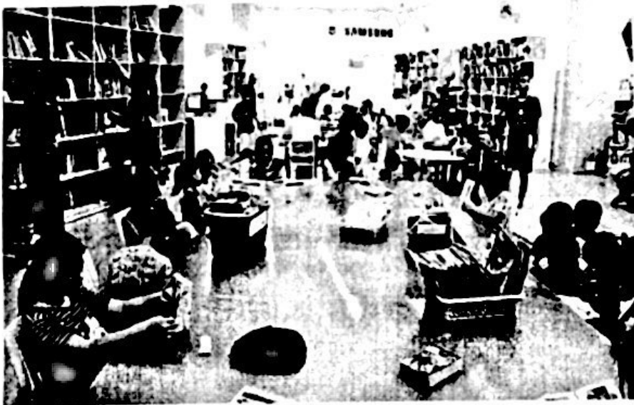
Ảnh: Không gian đọc sách cho thanh thiếu niên tại Thư viện Khoa học Tổng hợp Đà Nẵng [2]

thành phố sử dụng các dịch vụ của thư viện công cộng. Trung bình mỗi năm, hệ thống thư viện công cộng của thành phố Đà Nẵng được bổ sung hơn 17.600 bản sách giấy, gần 1.200 bản sách điện tử và 235 đầu báo - tạp chí khác, giúp gần 8.700 lượt người mượn đọc, góp phần nâng cao văn hóa, chất lượng đọc trong cộng đồng. Thư viện cũng đã hoàn thành số hoá nguồn tài liệu địa chỉ, tài liệu quý hiếm các công trình nghiên cứu khoa học tại chỗ với tổng số 2.315 tài liệu. Bên cạnh đó, người quản lý, điều hành cũng dễ dàng nắm được thông tin nguồn tài liệu mà bạn đọc tìm kiếm nhiều nhất, để từ đó có hướng bổ sung, đáp ứng nhu cầu của bạn đọc. [2]